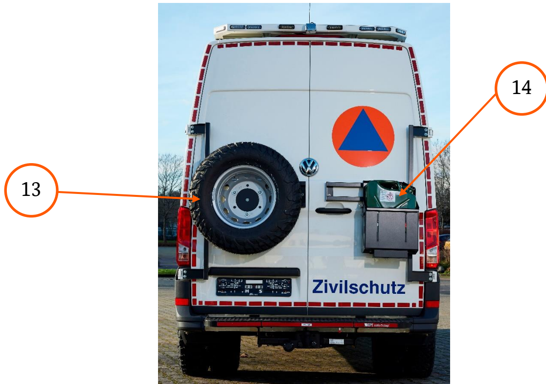
Abbildung 5 Heckansicht