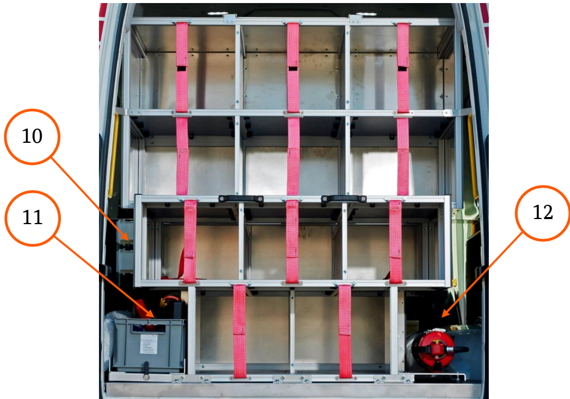
Abbildung 4 Heckregal