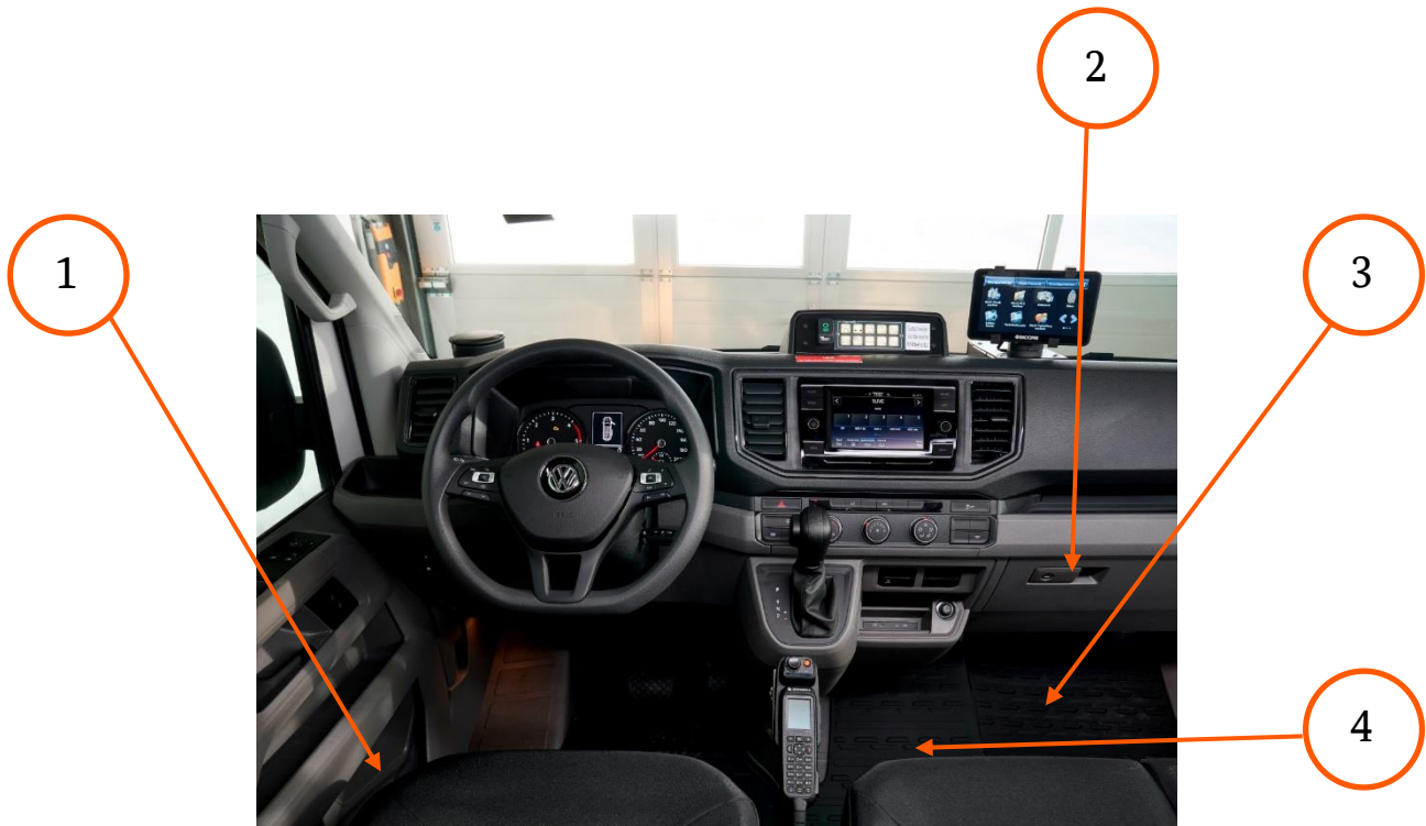
Abbildung 1 Fahrerraum