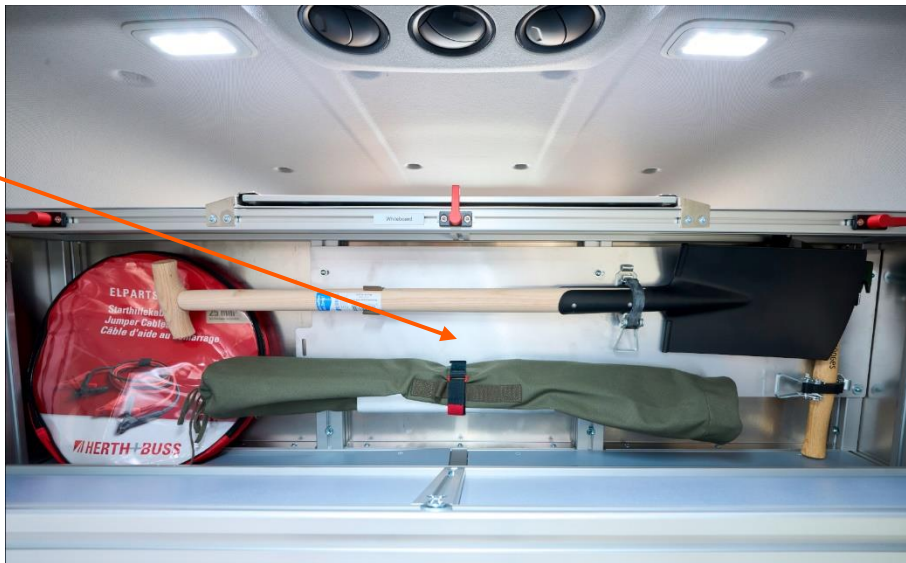
Abbildung 3 Staufach Mannschaftsraum